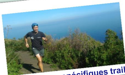
Parcours spécifiques trail

Chaussures de running, sac à dos avec vêtements adaptés suivant la saison et la météo.