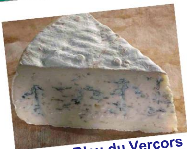
Bleu du Vercors

Chaussures de randonnée ou de sport Vêtements toute météo et imperméables Lunettes de soleil et crème solaire